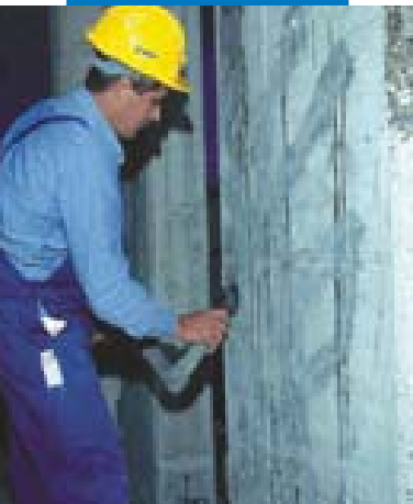
Preparazione del supporto