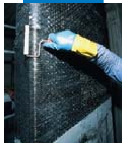
Applicazione della 2ª mano di Mapewrap 31