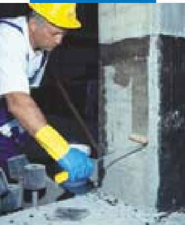
Applicazione di MapeWrap Primer 1