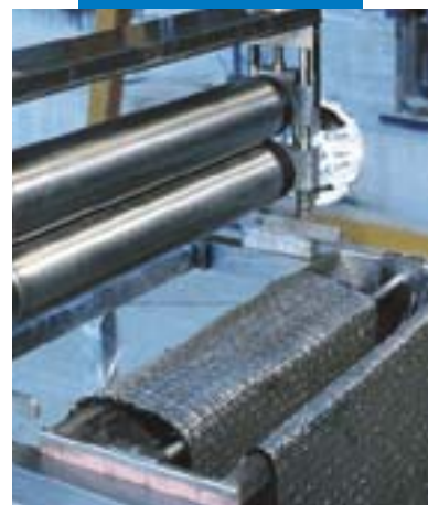
Impregnazione a macchina di Mapewrap C