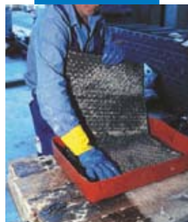
Impregnazione manuale di Mapewrap C