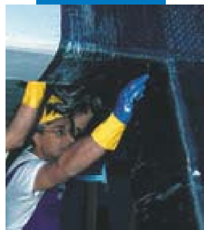
Fasciatura di un nodo