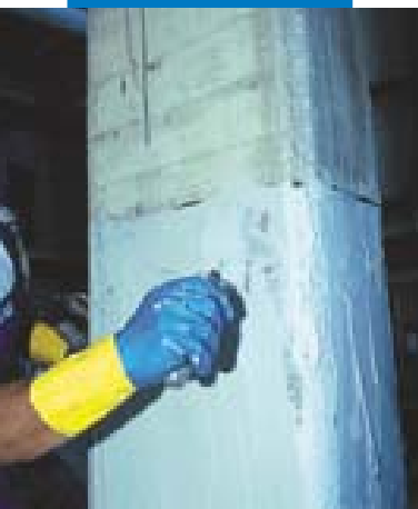
Rasatura con MapeWrap 11 o MapeWrap 12

eseguita in tempi estremamente brevi e spesso senza che sia necessario interrompere l'esercizio della struttura. Rispetto alla tecnica di placcaggio con piastre metalliche (beton plaque), l'uso dei tessuti MapeWrap C Quadri-AX consente di adattarsi a qualsiasi forma dell'elemento da riparare, non necessita di sostegni provvisori durante la posa in opera ed elimina tutti i rischi connessi con la corrosione del rinforzo applicato.