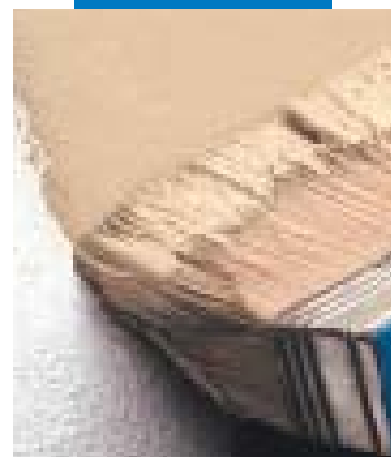
Rivestimento con Elastocolor